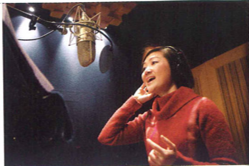
她的聲線可塑性甚高，扮小孩也沒問題。