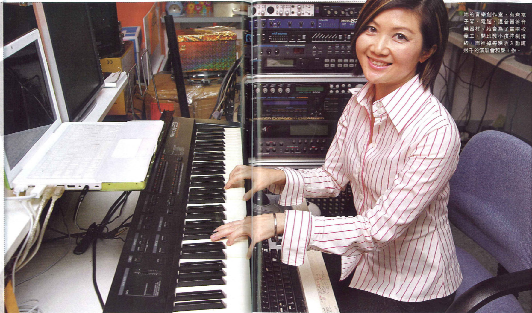
她的音樂創作室，有齊電子琴、電腦、混音器等音樂器材。她會為了當學校義工，開班教小孩控制情緒，而推掉每晚收入動輒過千的演唱會和聲工作。

奧運歌也唱了，遲些又替郭富城演唱會做和音。不敢跟她說，她打滾樂壇 22 年的廣告歌與流行曲，簡直是香港人集體回憶，伴你成長。